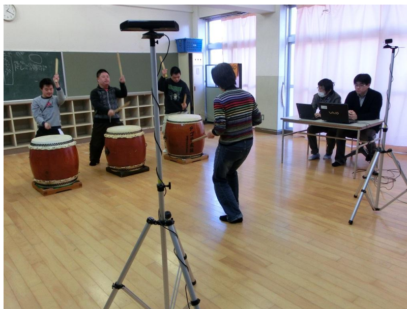
図3 Kinect™による和太鼓演奏記録の様子

具体的にはまず、本法人に参加している障害者の演奏練習中の、身体運動情報や音情報を長期的に記録していきます。得られたデータを解析することにより、個人個人の演奏能力が発達していく様子を定量的に把握することができるだけでなく、本法人という小さな社会における、集団の相互作用の科学的理解も進むことが期待できます。さらに、これらの研究成果に基づいて、より良い音楽療法を開発することも可能になると期待されます。