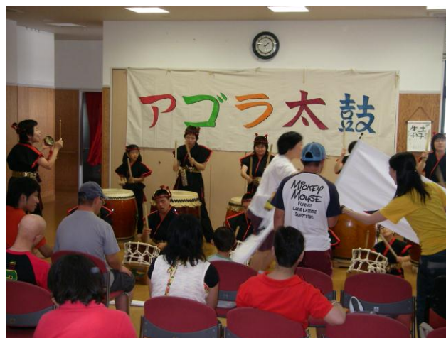
知的障がい者授産施設オープンスペース AYUMI にて交流会